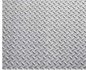
체크판 (TREAD PLATE)