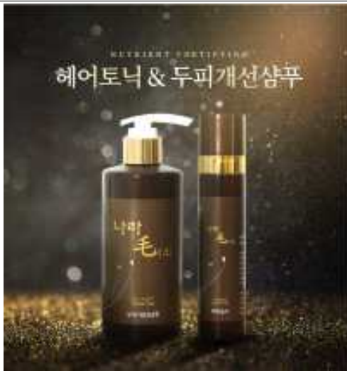
(토닉, 샴푸 셋트 사진)