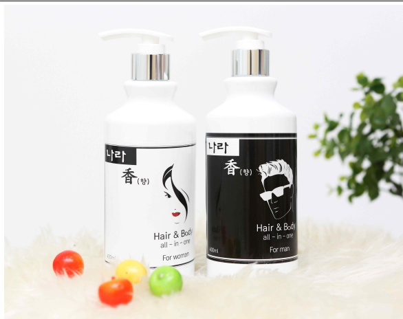
(바디워시 세트 사진)