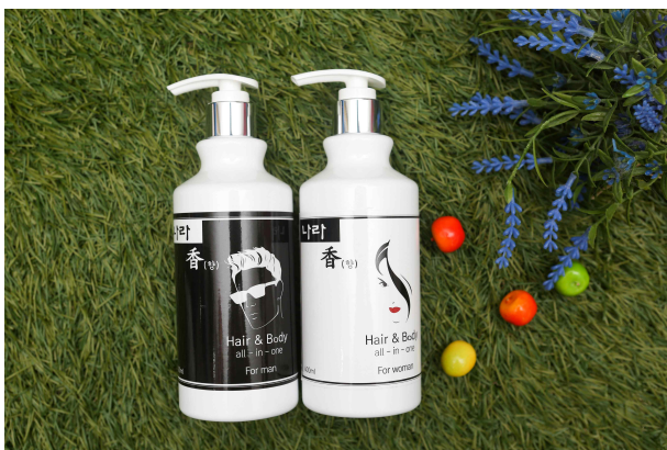
(바디워시 세트 사진)