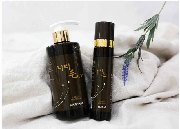
(토닉, 샴푸 셋트 사진)