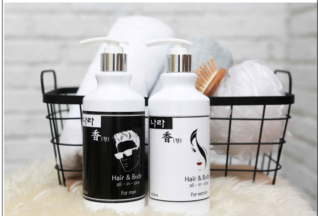
(바디워시 세트 사진)