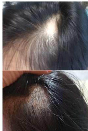
(원형 탈모 사용 전 후 사진)