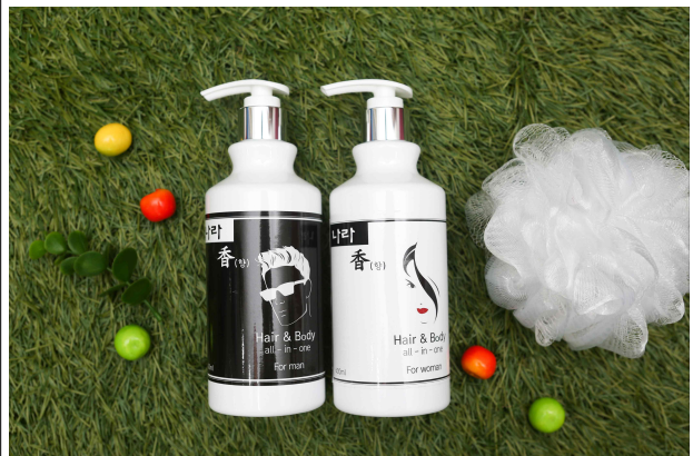
(바디워시 세트 사진)