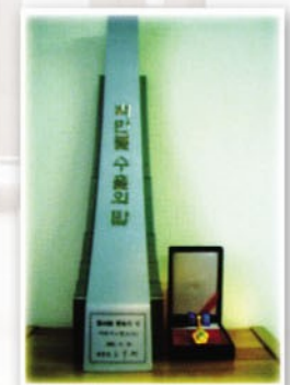
Million Dollar Export Tower