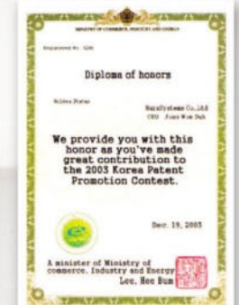
Patent Technology Fair Gold Medal