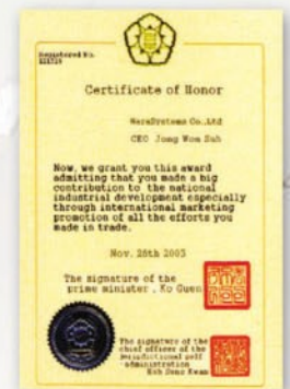
Prime Minister's Award